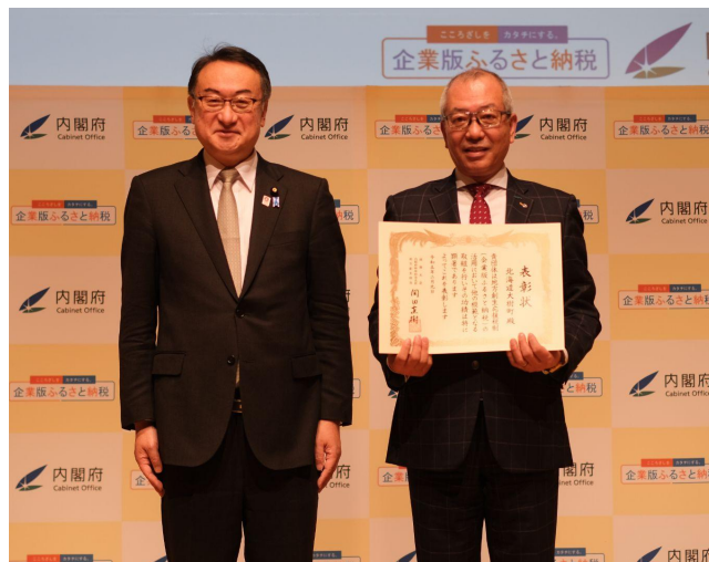
内閣府岡田大臣（左）と表彰を受けた酒森町長

受賞を励みにHOSPO整備を進め、北海道に航空宇宙産業が集積する宇宙版シリコンバレー創造により、北海道の発展、さらには国の発展にも貢献してまいります。引き続き皆様のご支援をお願いいたします。